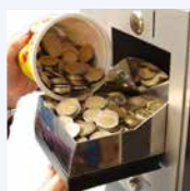
Volcado de monedas