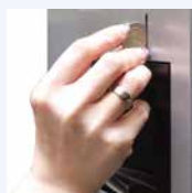
Ranura para introducción de monedas