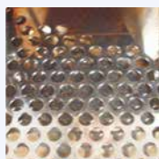
Cajón de carga especial